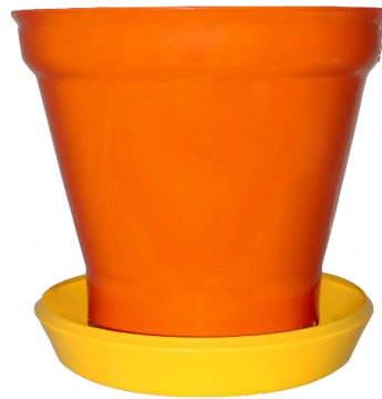
Pollos, gallinas y aves de traspatio